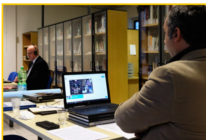
La sede del Circolo trasformata in studio per la trasmissione