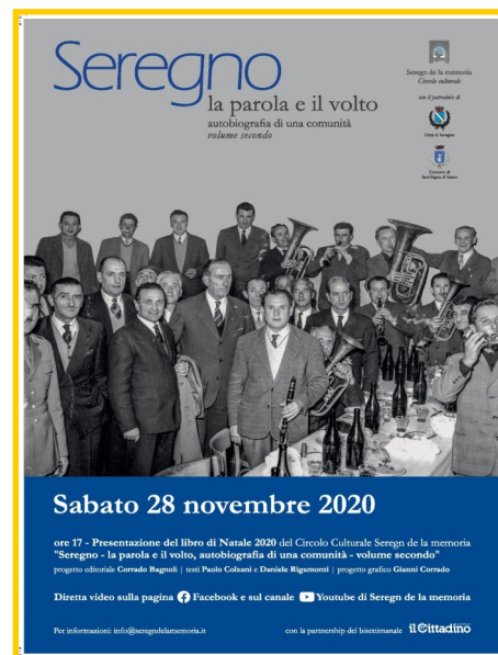
La locandina del libro