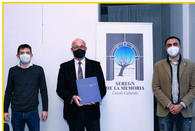
La presentazione ufficiale del libro