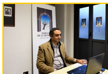
Gli attori della trasmissione