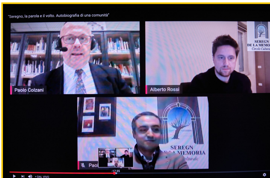
Una immagine della trasmissione